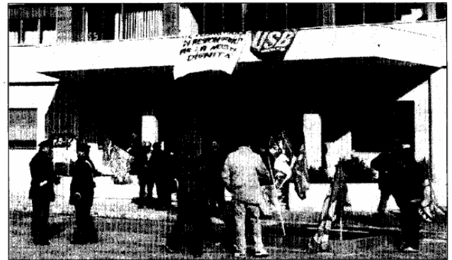
Gli uffici della Asl sono occupati da due giorni

caso - ha sottolineato Palazzo, che sia noi sindacati, che l'assessore, siamo stati invitati ad un confronto l'estate scorsa, dalla giunta regionale della Sicilia, così come da Renata Polverini, presidente della Regione Lazio, perché interessati ad applicare il sistema pugliese delle internalizzazioni che porterebbe Asl e quindi Regioni ad un risparmio del 50% della spesa». Non resta che capire come, nelle prossime ore, si muoveranno le forze politiche ai vari livelli. Se, oppure no, dietro l'angolo ci sarà una vera mobilitazione. E per oggi, alle 17, è annunciata la "visita" alla Asl dell'assessore Fiore.